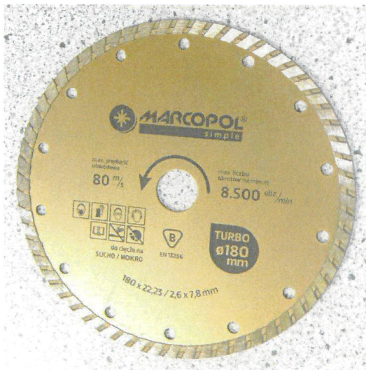
Ściernica z nasypem diamentowym TURBO / Cutting-off wheel with TURBO diamond rim 180×22,23/2,6×7,8

Załącznik stanowi integralną część Certyfikatu Nr B-048/22. This Attachment forms an integral part of the Certificate No. B-048/22.