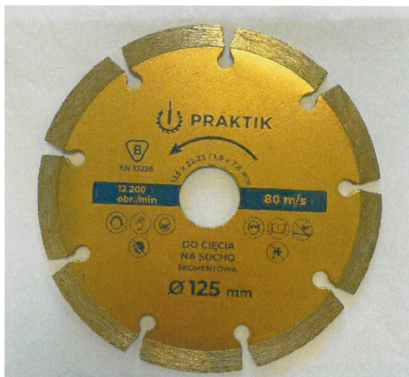
Ściernica z segmentami diamentowym / Cutting-off wheel with segmented diamond rim 125×22,23/1,8×7,8

Załącznik stanowi integralną część Certyfikatu Nr B-047/22. This Attachment forms an integral part of the Certificate No. B-047/22.